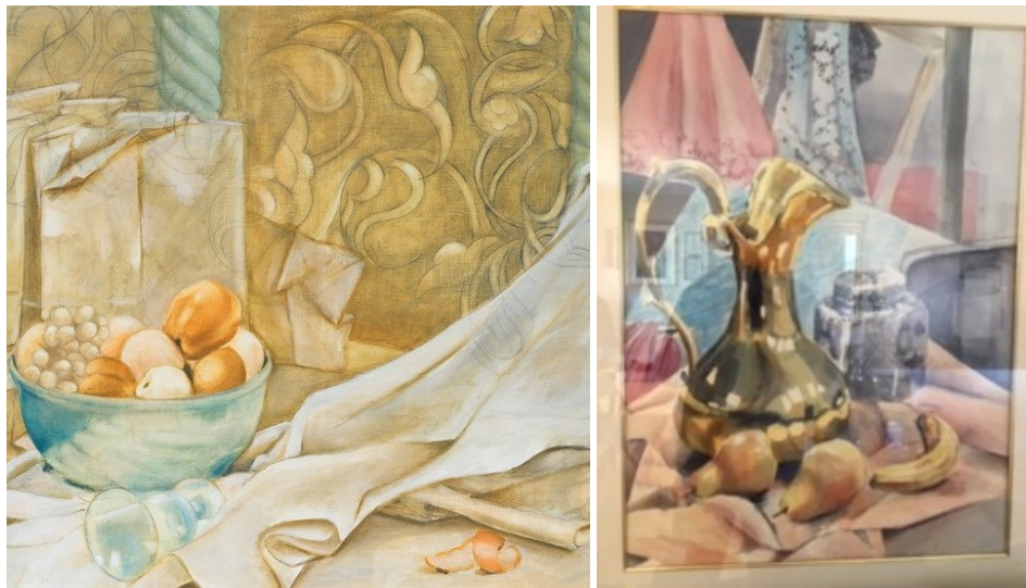
نقاشی های رنگ و روغن