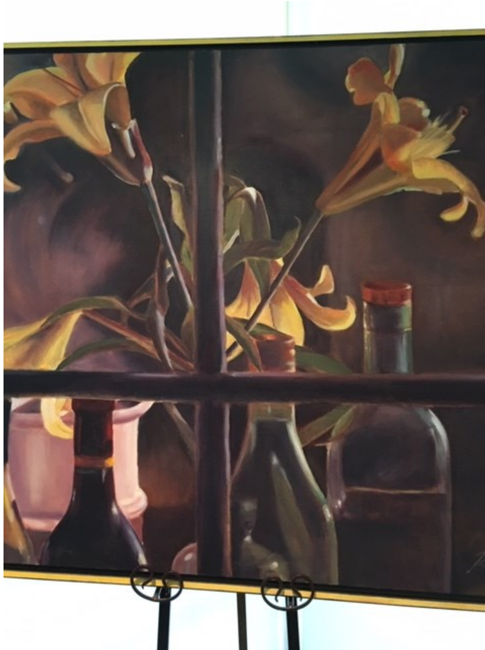
نقاشی رنگ و روغن