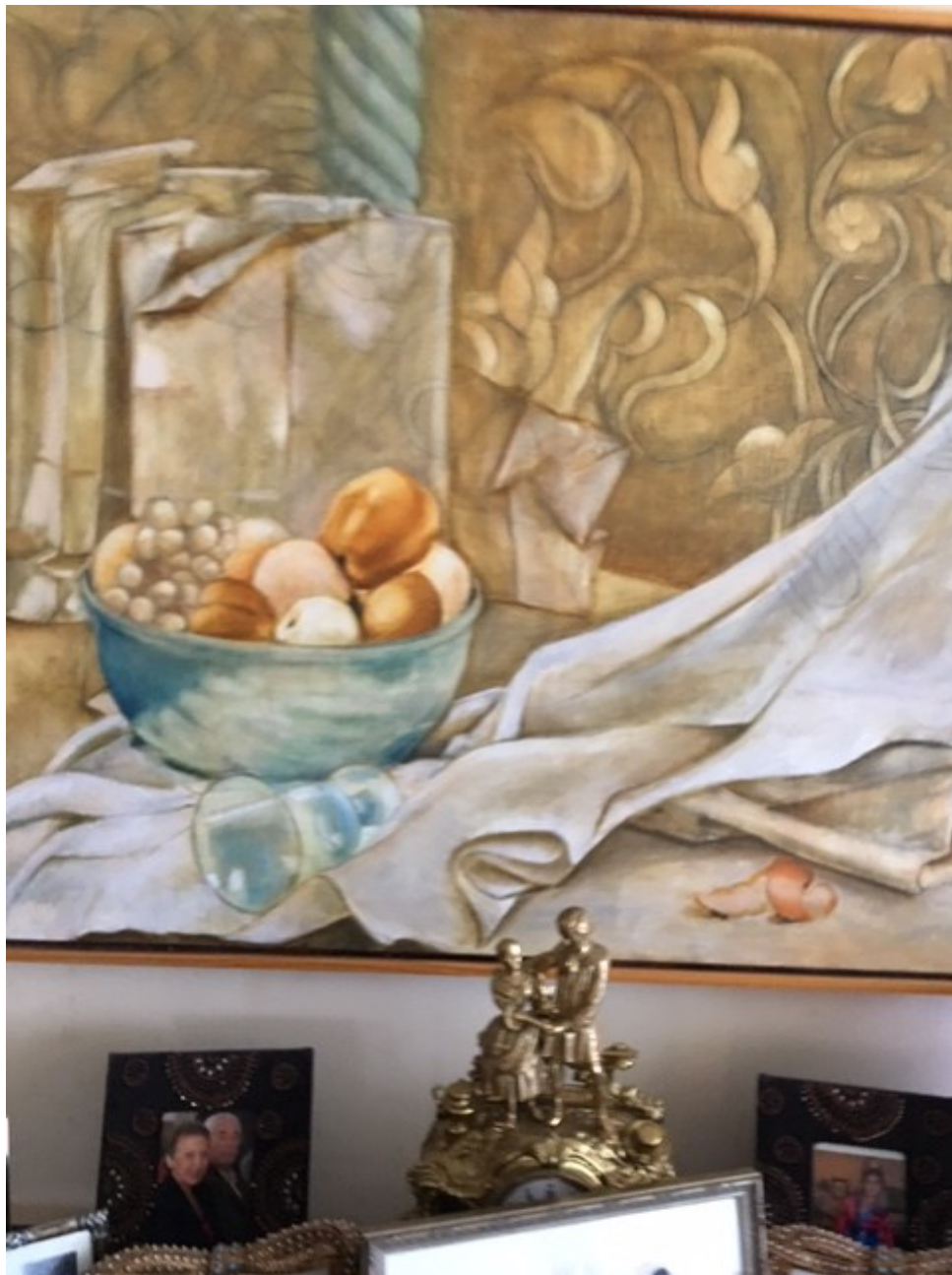
نقاشی رنگ و روغن